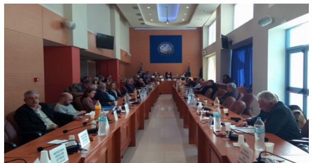
Περιφερειακό Συμβούλιο 23.02.2017 Στιγμιότυπο από τη συνεδρίαση σχετικά με την ενημέρωση για την πορεία υλοποίησης του σχεδιασμού EER 2017 & την έγκριση του Καταστατικού ΣΕΑΔΕ