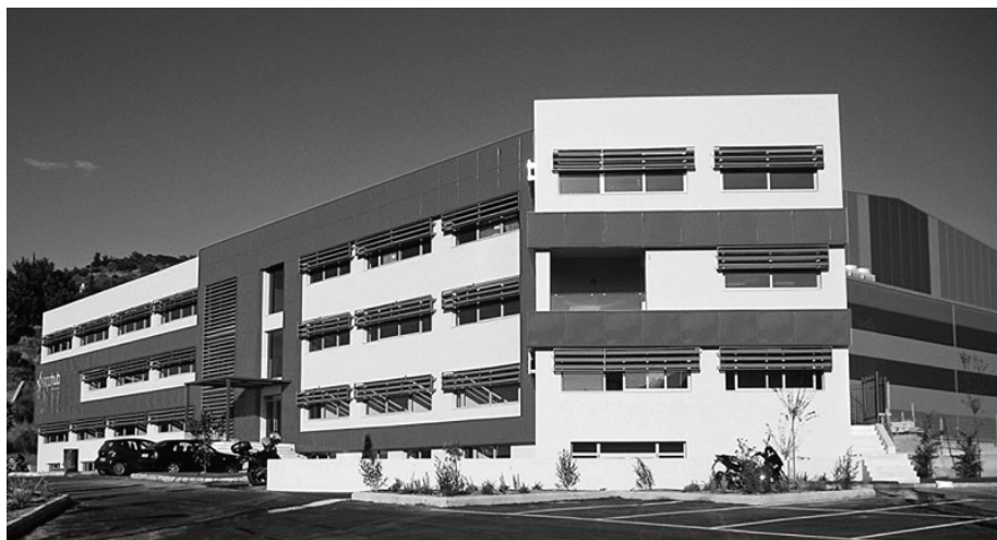
Άποψη του Patras InnoHub στη θέση Μαγούλα Κάτω Καστριτσίου Πατρών.