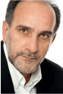
Απόστολος Κασιφάρας Περιφερειάρχης Δυτικής Ελλάδας

Η Περιφέρεια Δυτικής Ελλάδας είναι παραδοσιακά η Πύλη της Ελλάδας στη Δύση, αποτελώντας κέντρο εμπορίου, υπηρεσιών, πολιτισμού, κοινωνικής πρωτοπορίας και καινοτομίας. Σε αυτό το πλαίσιο ο Μικρο-μεσαίες Επιχειρήσεις (ΜμΕ) της περιοχής μας, είχαν και έχουν πρωταγωνιστικό ρόλο.