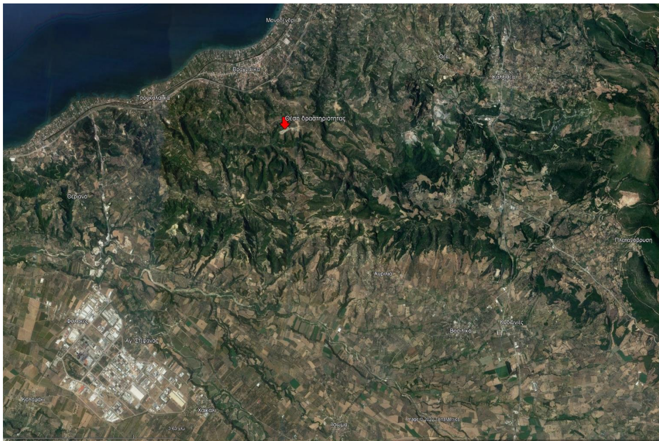
Χάρτης 2 : Θέση δραστηριότητας στην Π.Ε. Αχαΐας