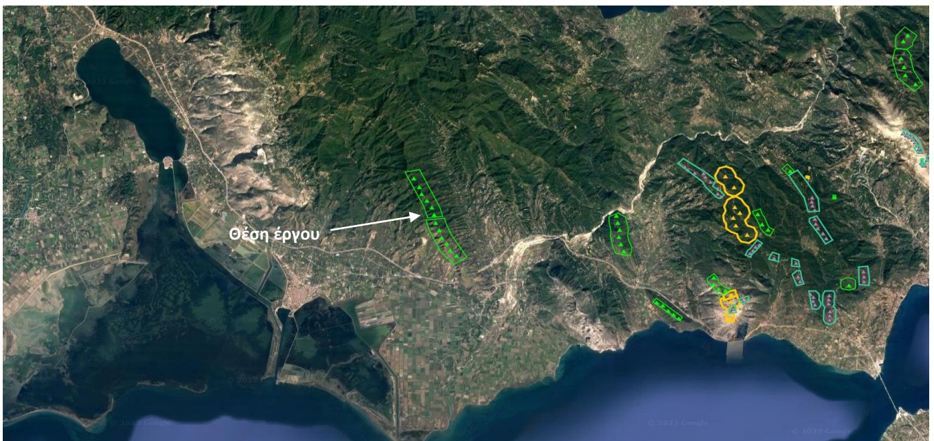
Εικόνα 2 : Θέση έργου και άλλα ομοειδή έργα

Στην ευρύτερη περιοχή εγκατάστασης υπάρχει ένας ακόμα ΑΣΠΗΕ με άδεια παραγωγής της εταιρείας «ΕΝΕΡΓΕΙΑΚΗ ΒΟΥΡΣΑΝΑ Μ.Α.Ε.» ενώ δυτικά του προτεινόμενου έργου βρίσκονται και άλλα ομοειδή έργα σε μεγάλη απόσταση (>8km).