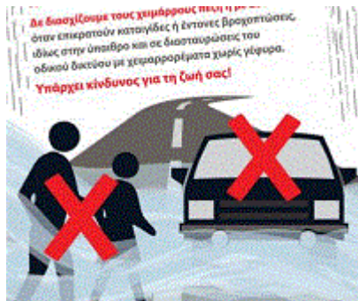
Αφίσα για πλημμύρες