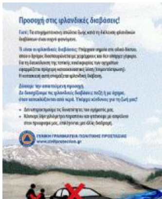
Μονόφυλλο για ιρλανδικές διαβάσεις