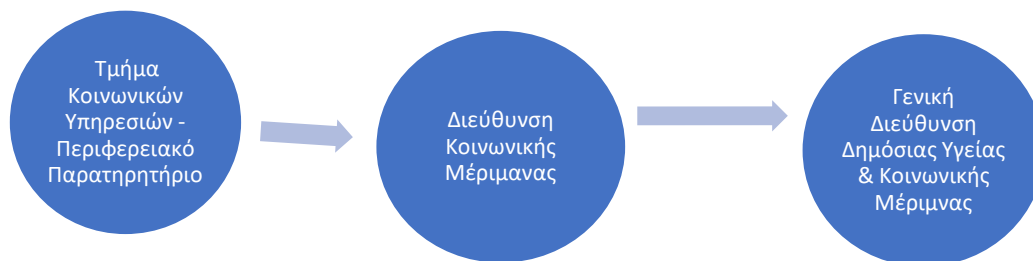
Σχήμα 1: Περιφερειακό Παρατηρητήριο

Ο Ανάδοχος στο πλαίσιο υποστήριξης του ΠΕ Α και σε συνεννόηση με την Γενική Διεύθυνση Δημόσιας Υγείας και Κοινωνικής Μέριμνας δεσμεύεται για την επιτόπια υποστήριξη της λειτουργίας του Περιφερειακού Παρατηρητηρίου Κοινωνικής Ένταξης.