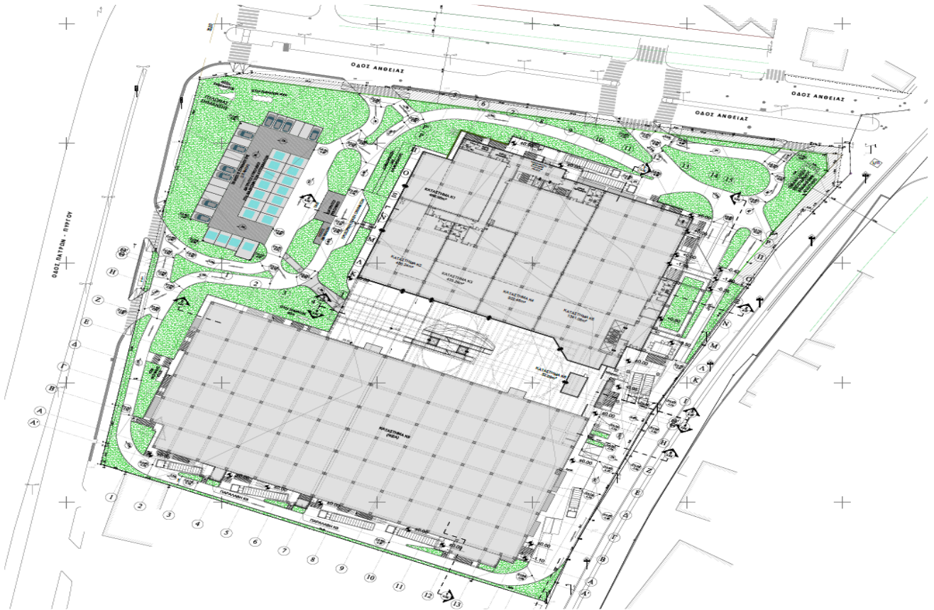
Χάρτης 2 : Τοπογραφική αποτύπωση Κτιριακού Συγκροτήματος Εμπορικών Καταστημάτων

Η νέα εγκατάσταση για να πετύχει ένα φιλικό προς το περιβάλλον χαρακτήρα, με ελάχιστο δυνατό ενεργειακό αποτύπωμα, θα χρησιμοποιήσει υαλοστάσια με ενεργειακά κρύσταλλα υψηλής απόδοσης, κουφώματα με θερμοδιακοπή, σκίαστρα κ.λπ. Ακόμη, θα προστατευθούν και τα μεγάλα ανοίγματα (π.χ. σκίαση της εμπορικής στοάς, όπου βρίσκονται τα μεγάλα ανοίγματα των καταστημάτων). Οι επενδύσεις σε μεγάλο τους ποσοστό, προβλέπονται από ανακυκλωμένα υλικά με υψηλό συντελεστή θερμικής αντίστασης και μηδενικές θερμογέφυρες. Μεταξύ άλλων, προτείνονται ηλιακά πάνελ για ζεστό νερό, εγκατάσταση φωτοβολταϊκών συστημάτων κ.λπ.