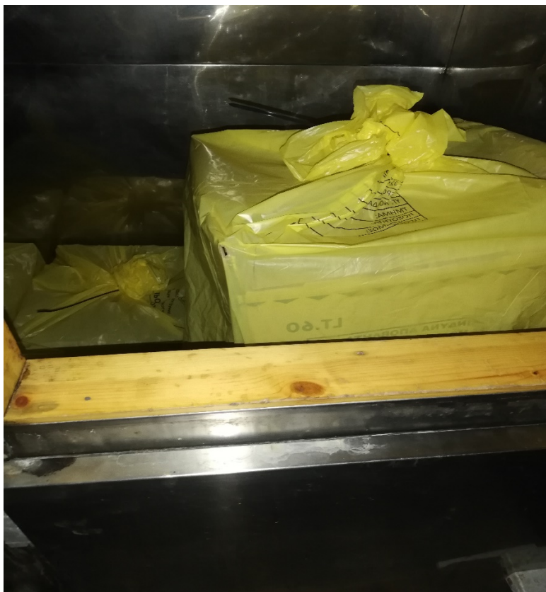
Φωτο 3: Ψυκτικός Θάλαμος ΕΑΥΜ