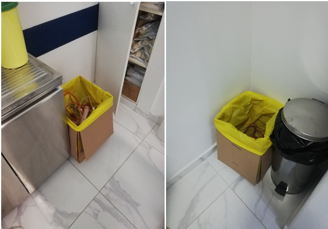
Φωτό 1 : Χρωματικοί περιέκτες για τη διαλογή των ΕΑΥΜ