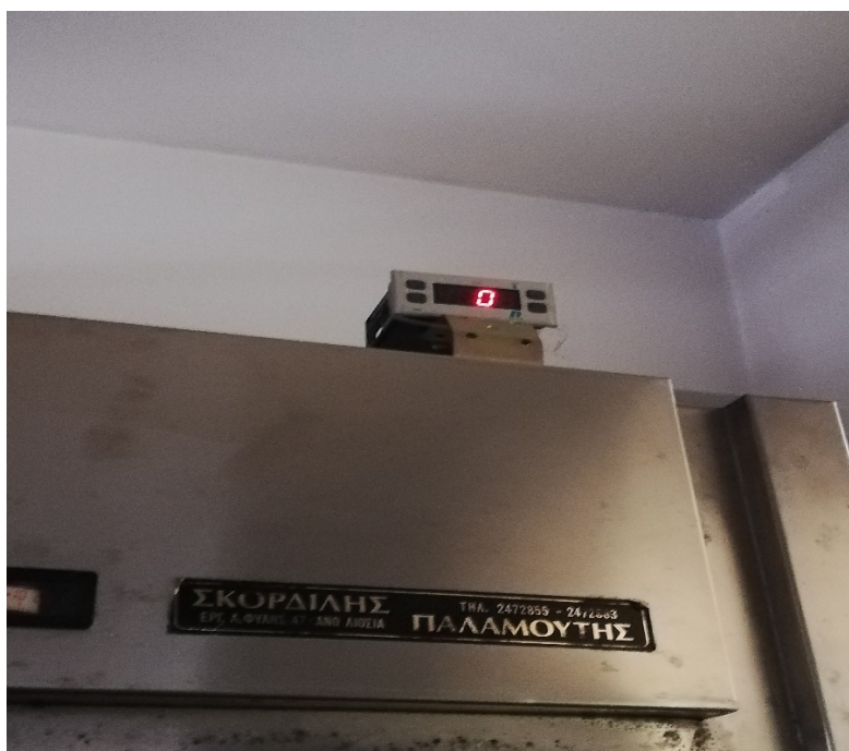
Φωτο 2: Θερμοκρασία Ψυκτικού Θαλάμου ΕΑΥΜ