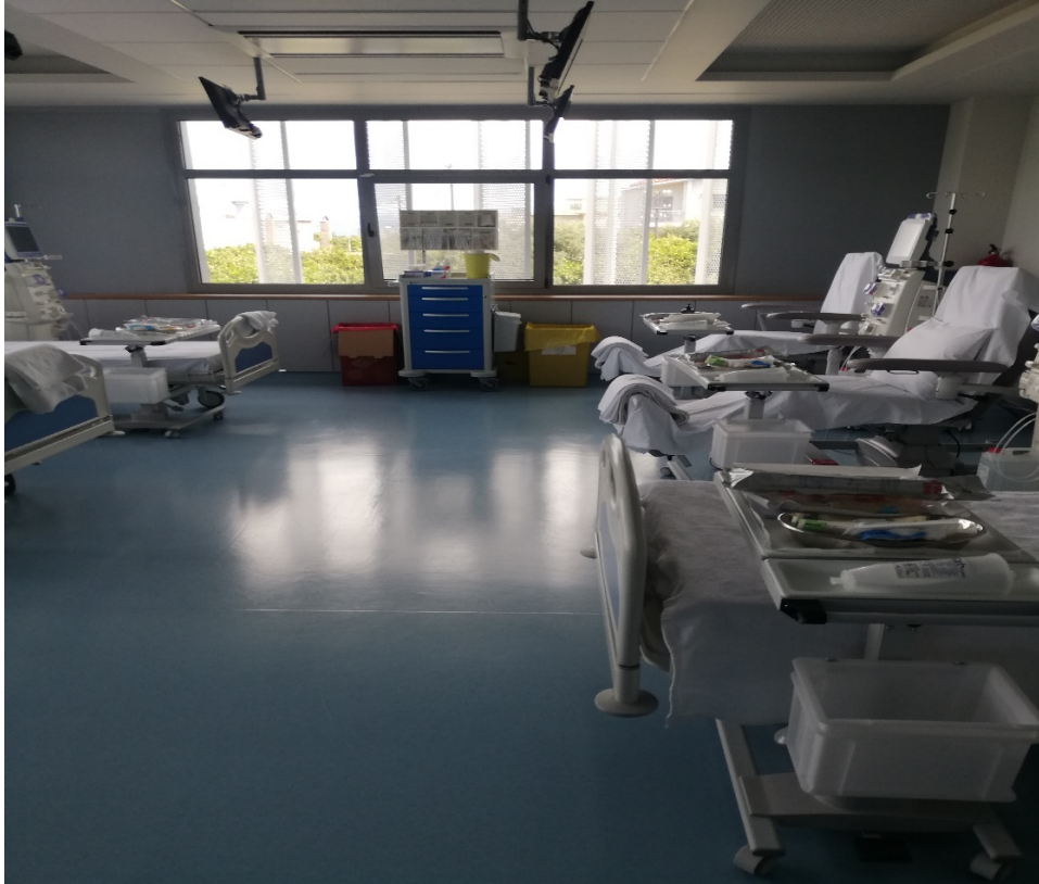
Φωτο 2 : Χρωματιστοί περιέκτες για την διαλογή EAYM