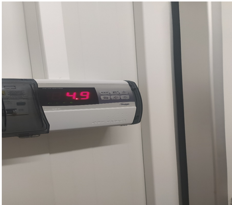
Φωτο 5: Θερμοκρασία ψυκτικού θαλάμου