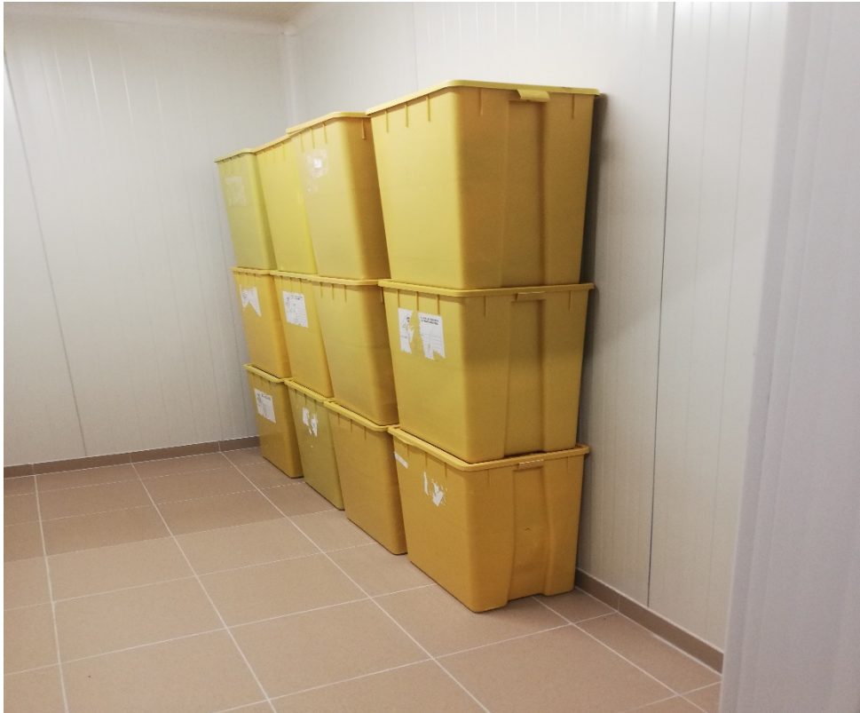
Φωτο 4: Ψυκτικός Θάλαμος ΕΑΥΜ