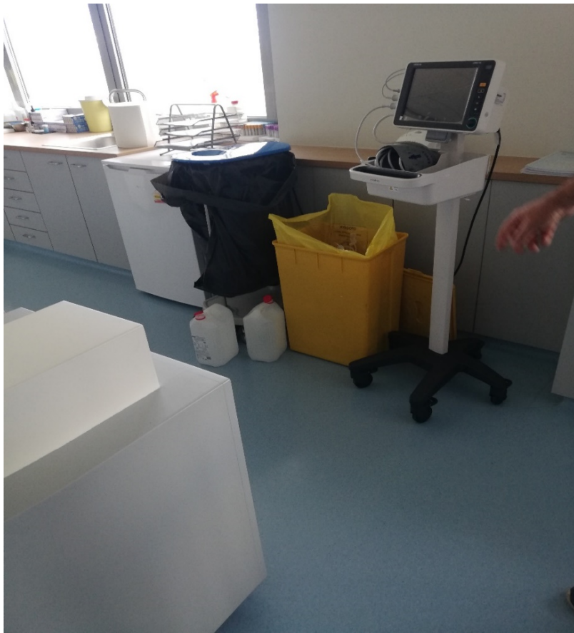
Φωτο 1 : Χρωματιστοί περιέκτες για την διαλογή ΕΑΥΜ