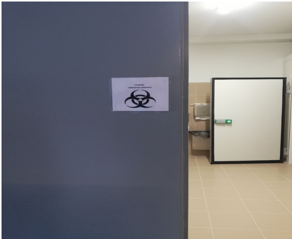
Φωτο 3 : Σήμανση του χώρου αποθήκευσης επικίνδυνων αποβλήτων