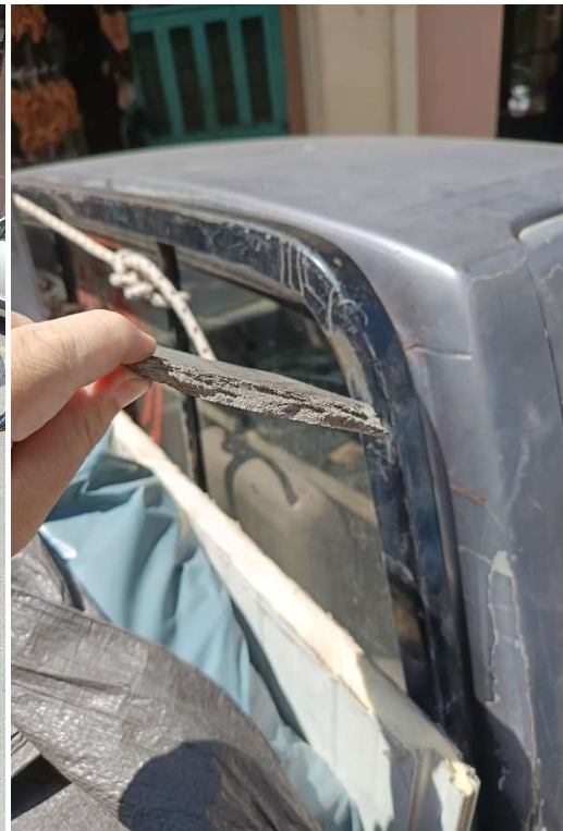
Εικόνες 5, 6 και 7 : Ι.Χ.Φ με σακούλες που περιείχαν κομμάτια από δομικά στοιχεία αποξηλωμένου ελενίτ