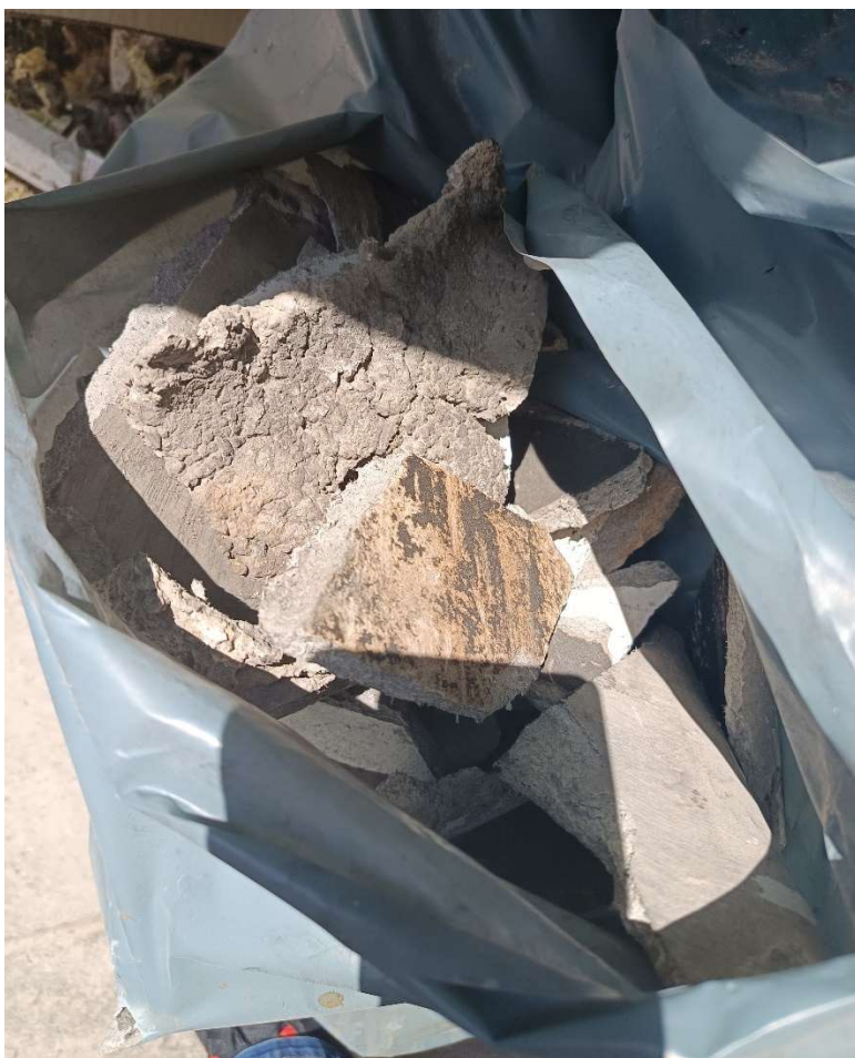
Εικόνες 1 και 2 : Σακούλες που περιέχουν κομμάτια από δομικά στοιχεία αποξηλωμένου ελενίτ, έμπροσθεν του ακινήτου