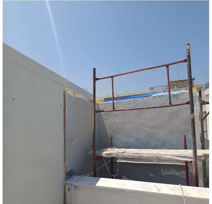
Εικόνες 3 και 4 : Δώμα που έλαβε χώρα η αποξήλωση των στοιχείων αμιάντου και η αντικατάστασή τους με πάνελ πολυουρεθάνης

Στη συνέχεια διενεργήθηκε έλεγχος και στο κατασχεμένο Ι.Χ.Φ. επί του οποίου διαπιστώθηκαν επίσης σακούλες που περιείχαν κομμάτια από δομικά στοιχεία αποξηλωμένου ελενίτ, όπως φαίνεται στις κάτωθι φωτογραφίες :