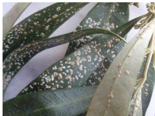
Προσβολή από ασπιδιωτό