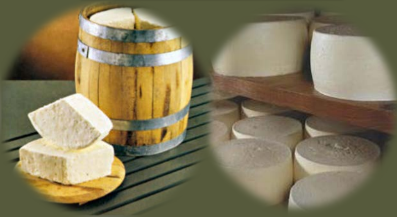
ΦΕΤΑ - ΚΕΦΑΛΟΓΡΑΒΙΕΡΑ