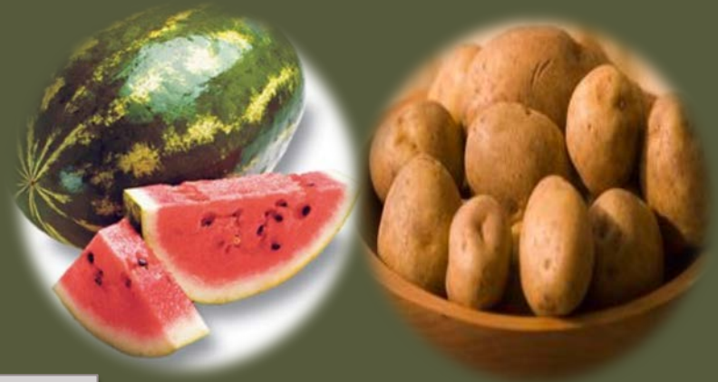
ΚΑΡΠΟΥΖΙ - ΠΑΤΑΤΑ