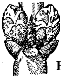
Έναρξη διόγκωσης οφθαλμών