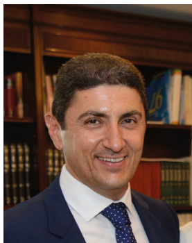
Χαιρετισμός του Υφυπουργού Αθλητισμού, κ. Λευτέρη Αυγενάκη

Τα τελευταία δυόμισι χρόνια, κάναμε πολλές και βαθιές τομές στον αθλητισμό. Τομές που έσπασαν την αρτηριοσκλήρωση των κακών πρακτικών, που για πολλά χρόνια ταλαιπωρούσαν το αθλητικό οικοσύστημα. Τομές με πληθώρα καινοτόμων ρυθμίσεων για όλες τις μορφές του αθλητισμού.