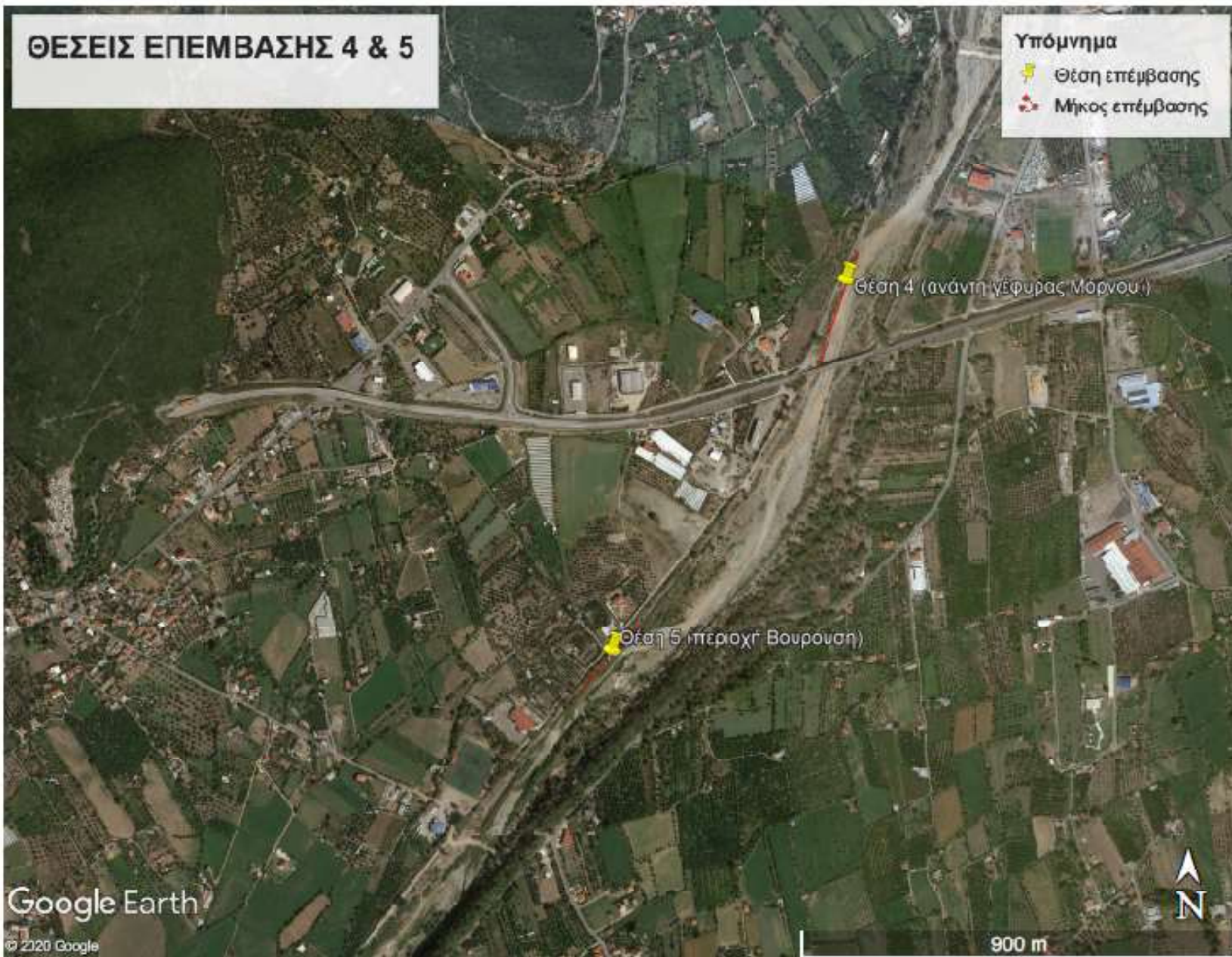
Εικ.2 : Απόσπασμα δορυφορικής εικόνας Google-Earth με τις θέσεις των επεμβάσεων 4και 5