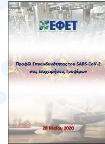
«Προφίλ Επικινδυνότητας του SARS-CoV-2 στις Επιχειρήσεις Τροφίμων»