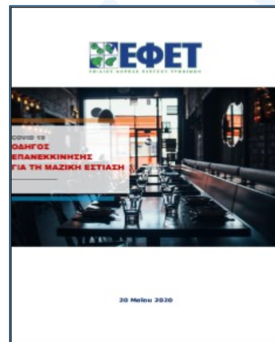
«Οδηγός Επανεκκίνησης για τη Μαζική Εστίαση»