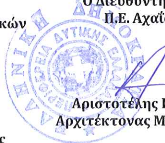
Αριστοτέλης Κορκός Αρχιτέκτονας Μηχανικός