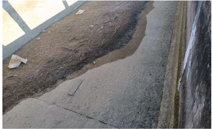
Θέση 8 ↓