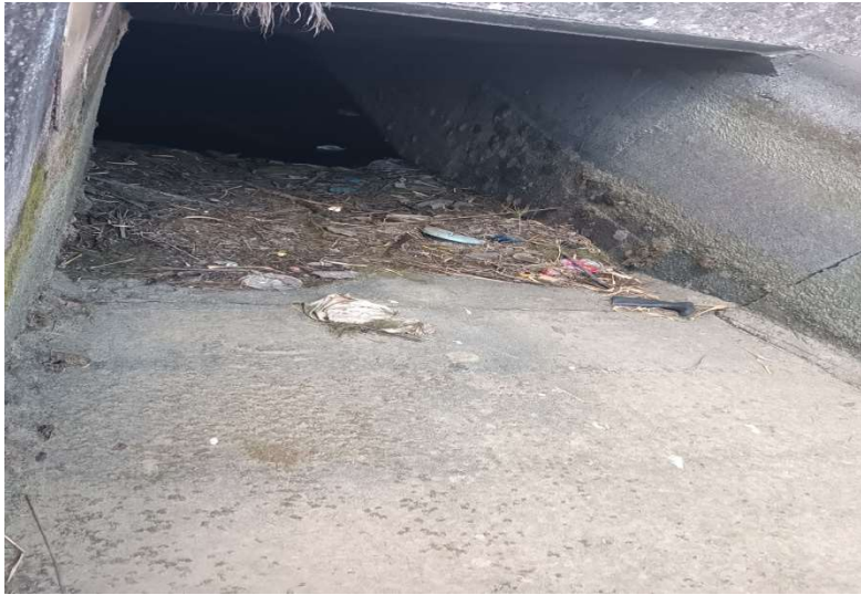
Θέση 7 ↓