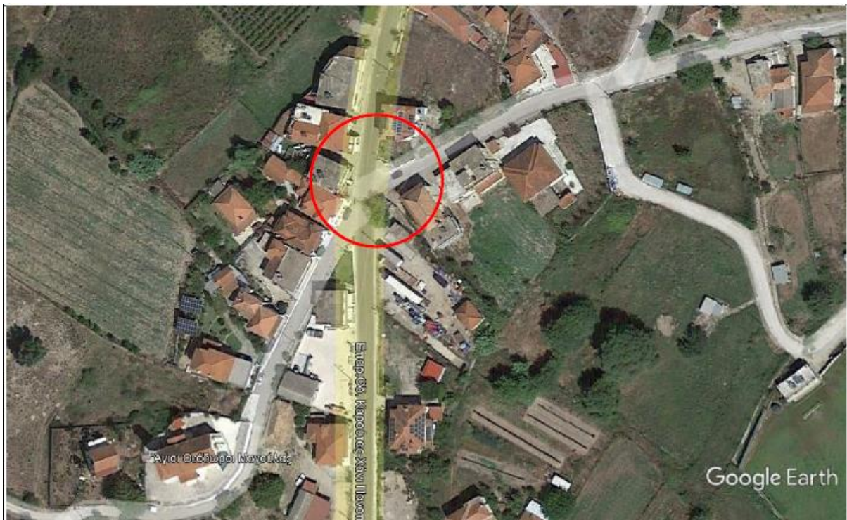
Εικόνα 3: Περιοχή ισόπεδου κόμβου στην Μαγούλα προς Ωλενα (κόμβος 3-ΜΑΓΟΥΛΑ)

και η θέση του κόμβου 3 (ΜΑΓΟΥΛΑ) βρίσκεται εντός των διοικητικών ορίων της Δ.Ε. Ωλένης/ Τ.Κ. Μαγούλας του Δήμου Πύργου, της Π.Ε. Ηλείας της Περιφέρειας Δυτικής Ελλάδος.