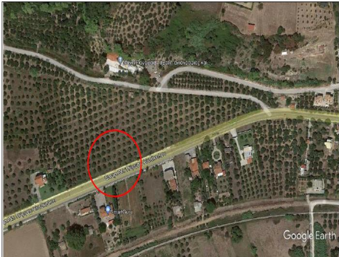
Εικόνα 1: Περιοχή ισόπεδου κόμβου επί της Πύργου – Κατακόλου (κόμβος 1-ΛΑΣΤΕΪΚΑ)

Η θέση του κόμβου 1 (Λασταίκα) βρίσκεται εντός των διοικητικών ορίων της Δ.Ε. Πύργου/Τ.Κ. Λασταίικων του Δήμου Πύργου,